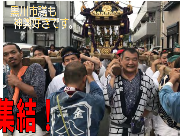
黒川市議も 神輿好きです。