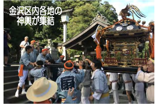
金沢区内各地の 神輿が集結

「金沢区内の各地から神輿が集結してのパレードは10年振りのことです。私もお祭り好きの一人として、尽力してくれ