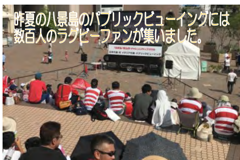
昨夏の八景島のパブリックビューイングには 数百人のラグビーファンが集いました。

もう一つは、アイルランドとスコットランドのキャンプ地として決まっている関東学院大学と横浜市立大学での子供たちとの交流プログラムです。2002年のサッカーワールドカップではキャンプ地とチームの交流が話題になりました。その再現を金沢区でぜひと、提案しています。