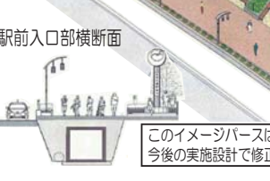
このイメージバスは確定したものではありません。今後の実施設計で修正・変更される可能性があります。

平成19年度から20年度にかけて、金沢文庫の西口の出口から駅前ロータリーにかけての通路が整備されます。金沢区と道路局の連携事業として区民の意見を大きく取り入れた取り組みとして計画されたもので、川を部分的にふたがけをして、ゆとりと安らぎのある人にやさしい駅前空間となります。