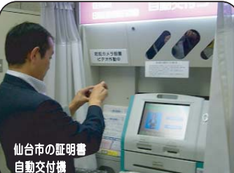
仙台市の証明書自動交付機

★区への権限委譲の取組 金沢区の個性を生かした発展のためには、区独自の予算や政策を区民のみなさんとともに話し合い、意見を吸い上げる仕組みを作るのが大切です。高齢化社会への取組や子育て支援も市内の北部や都心部と南部とでは状況も異なりますし、対策