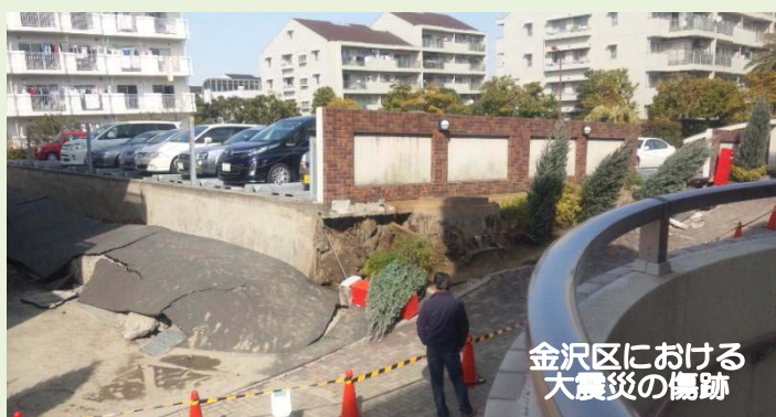
金沢区における大震災の傷跡

しかし、このような時には市民のニーズは千差万別で、それぞれに応じた対応が必要で、その時に力を発揮しなければならぬのが政治家だと私は考えます。金沢区でも今回の震災で苦しんでいる人たちがいます。現行の行政の常識では対応できないことだとしても、非常事態に直面して困っている区民・市民に対して何かできることはないかと知恵を絞らなければ政治家として市民から選ばれた責任は果たせません。